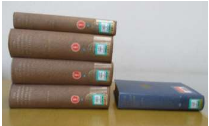
(2) ケンブリッジ大学から本学へ寄贈された図書 (所蔵・本学中央図書館)