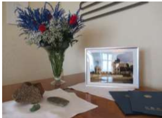
(4) アイスランド、レイキャビク市に寄贈されたレンガ

<以下の写真については、下記のお問い合わせ先にご連絡いただければ、お見せすることができます>