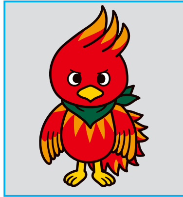
【マスコットキャラクター】