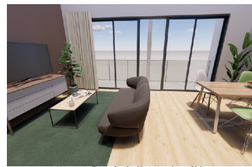
トップ研究者住居（7階）

令和6年刊行予定の広島大学75年史部局史編については、研究科、学部、センターから各一人ずつ、執筆の中軸を担う編さん担当者を9月末を目途に選出する。主なスケジュールは、下表のとおり。