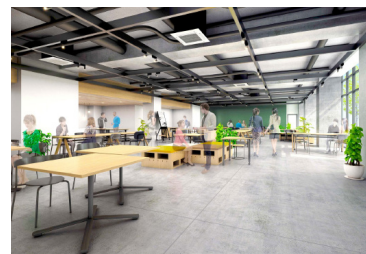
多目的スペース（1階）

ンボリッくな外観デザインとなっている。鉄筋コンクリート7階建て、延床面積3954㎡。総事業費約15億円、うち5億円は東広島市の出捐金を充てる。1・2階はエントランスを中心として、開放的でフレキシブルに使える多目的スペースやコミュニティキッチン、カフェ、会議室など。3階以上の宿舎スペースでは入居者同士の交流ラウンジなどを配置。7階にはトップクラスの研究者を呼び込むための居室も整備する。建物全体でバリアフリーにも配慮している。令和3年秋の開設計画。