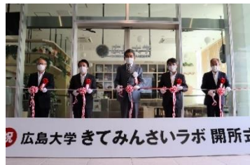
広島大学 きてみんさいラボ 開所式

サテライトスペース「広島大学 きてみんさいラボ」が10月16日にJR広島駅南口の広島JPビル2階に開所した。ラボは教育研究成果及び情報発信の場として活用するとともに、コワーキングスペースとしても利用できる。開館時間は、午前9時から午後8時まで(年末年始を除き、年中無休)。