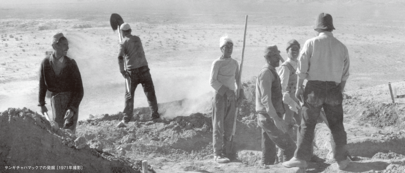
サンギチャハマックでの発掘 [1971年撮影]