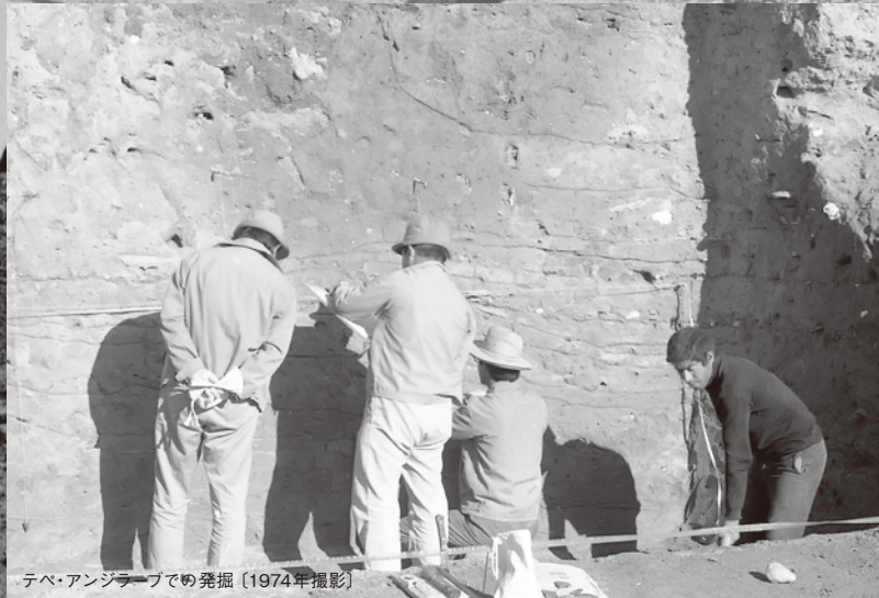
テベ・アンジラーブでの発掘 [1974年撮影]

七〇年代、日本人が滅多に足を踏み入れることのない土地で古代の謎を解明する一大プロジェクト。イランでの学術調査の困難やその調査はどのようなものだったのか回顧する。