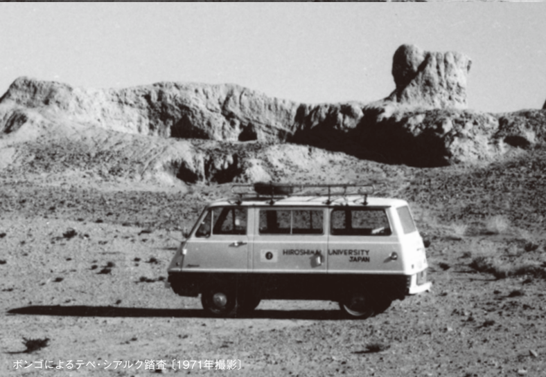
ホンゴによるテベ・シアルク踏査 [1971年撮影]