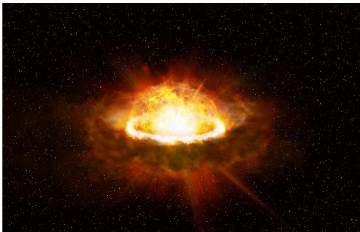
図 2. Ia 型超新星 Tomo-e202004aaelb (SN 2020hvf) を取り囲む星周物質と超新星放出物質の衝突の想像図